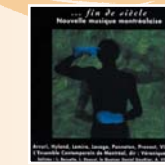
... fin de siècle